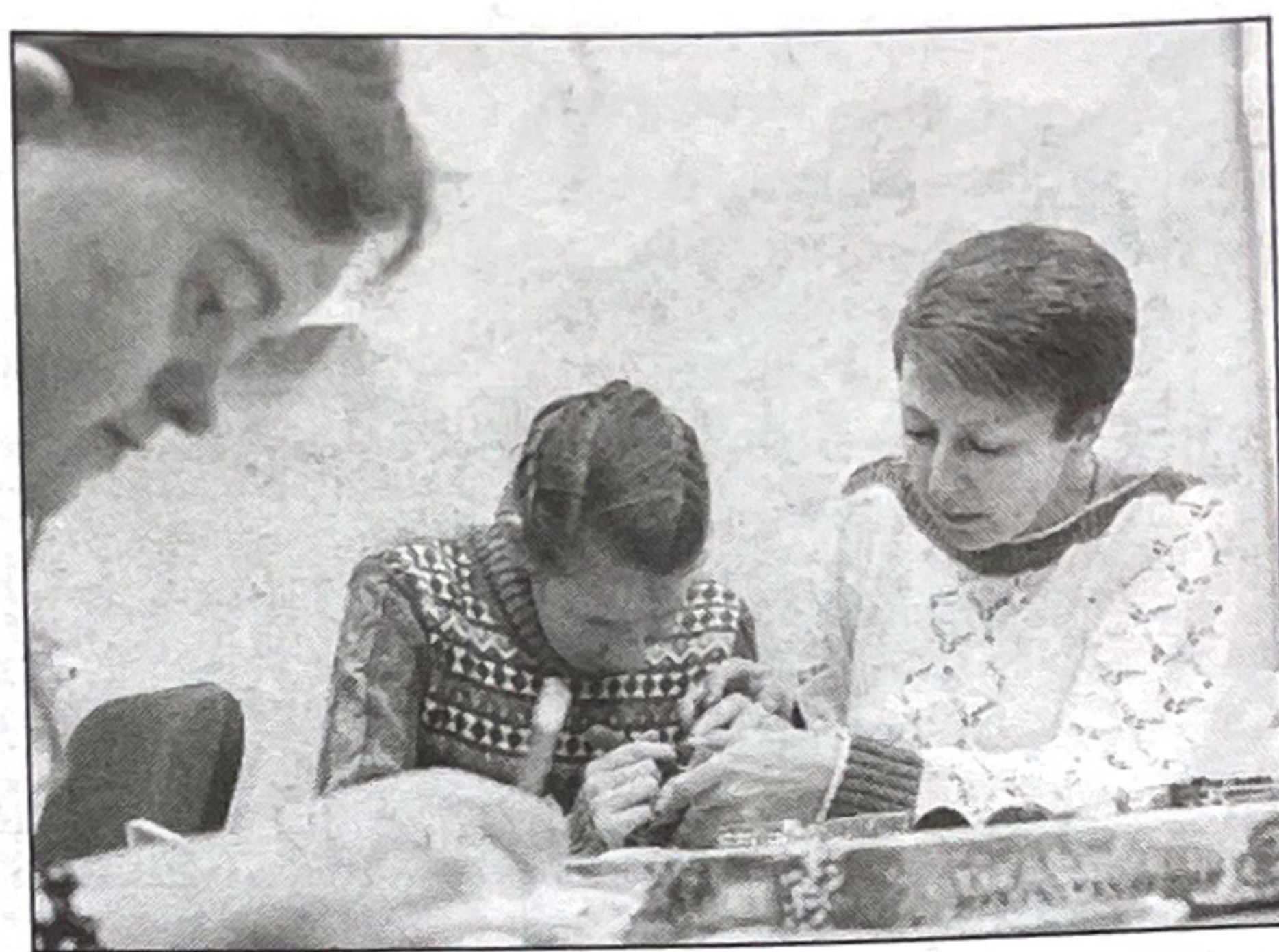
Педагоги обучают детей пению и домоводству.